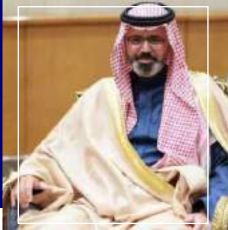
صاحب السمو الماكي الأمير ناصر بن محمد بن عبد الله بن جلوي آل سعود نائباً لأمير منطقة جازان