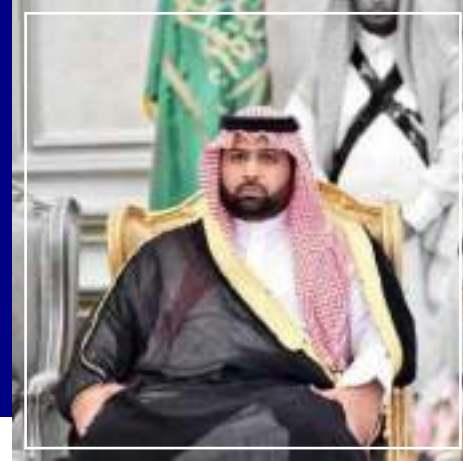
صاحب السمو الماكي الامير محمد بن عبدالعزيز بن محمد آل سعود أمير منطقة جازان